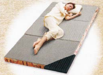
*****「ふんば」が心地よく見える。***** 整圧 敷きふとん