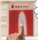
一般的な敷きふとん